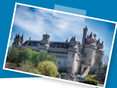
Château de Pierrefonds

N'hésitez pas à faire participer les familles : cette frise a été conçue comme un outil pour permettre aux enfants de visualiser l'histoire de France et ainsi de mieux l'intégrer. Plus elle sera enrichie, plus les enfants auront plaisir à la regarder et mémoriseront ainsi l'histoire de la France. Mettre en avant les histoires personnelles de chaque enfant permet aussi d'insister sur le fait que la grande histoire de France est une somme d'histoires individuelles.